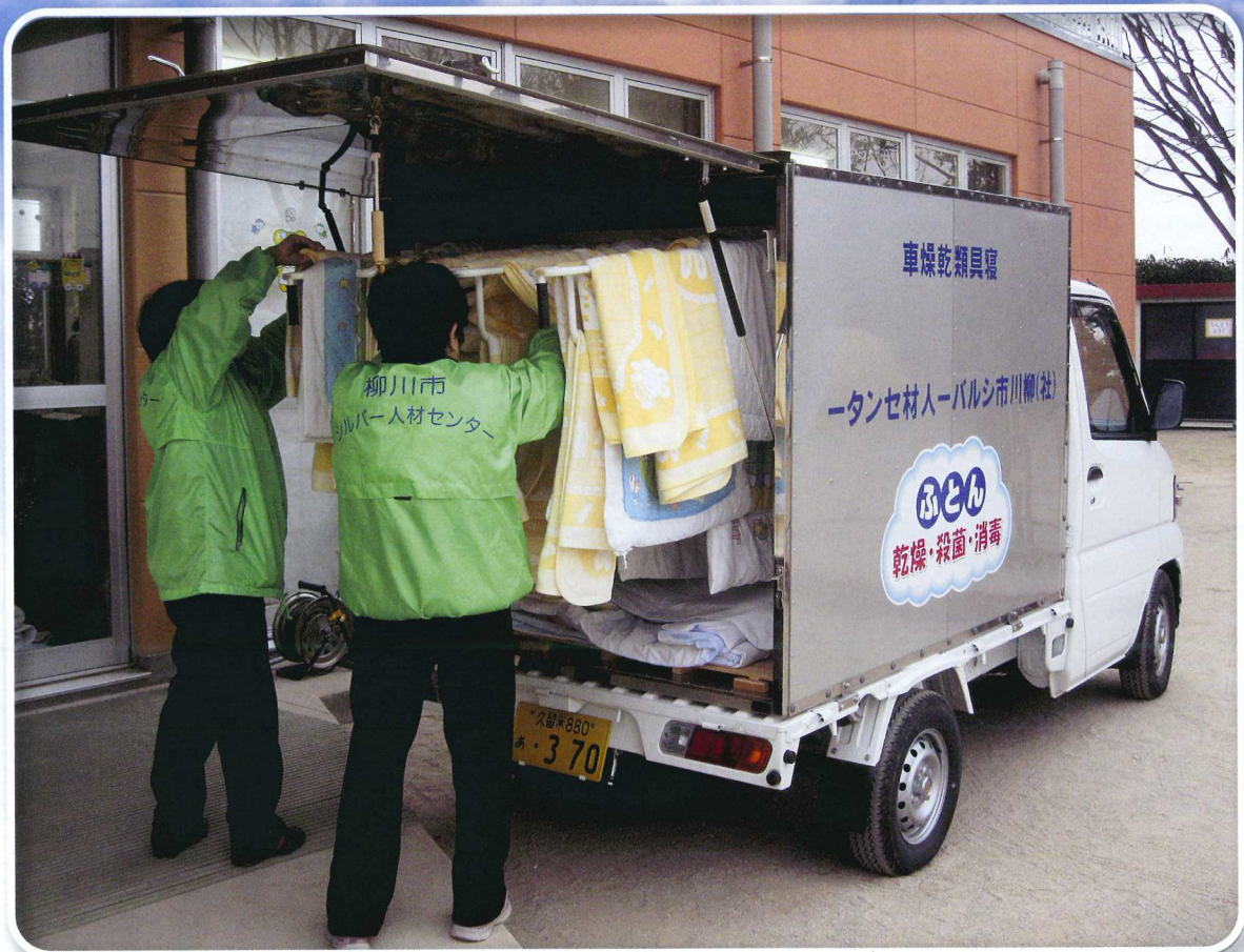
柳川市シルバー人材センター会員布団乾燥就業写真