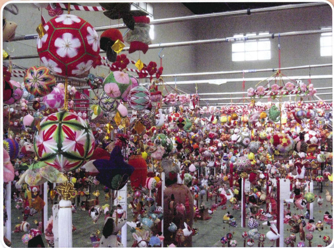
平成26年 さげもん展示即売会（今年度は平成27年1月24日・25日開催/柳川市民体育館にて）