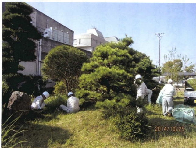
三橋地区 (三橋公民館周り)