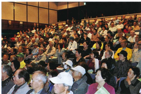
参加された会員の皆様