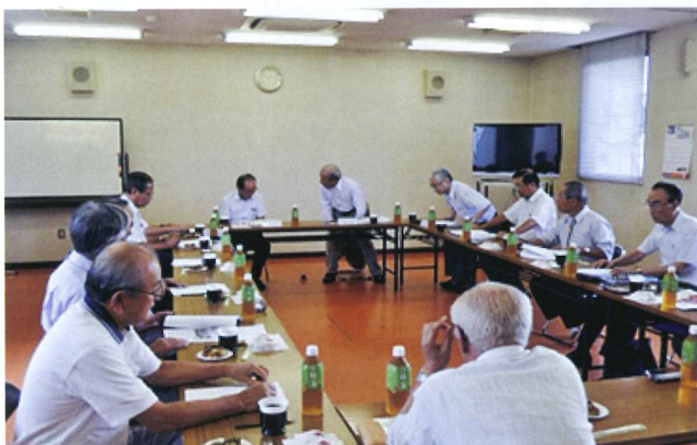
飯塚市シルバー人材センターにて

今後の柳川市シルバー人材センターも事業の充実、発展を図るために、互いに参考にしていきたいと思えます。