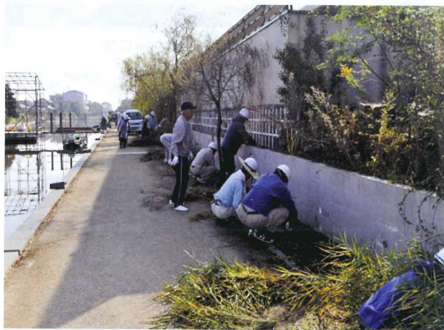
柳川地区 (かんぼの宿北側街路)