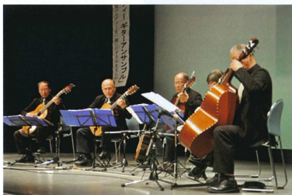
古賀メロディーギターアンサンブルによる演奏