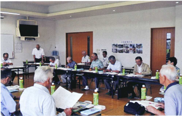
糸島市シルバー人材センターにて

事務所の所在地も市民の皆様が近寄り易い位置にあり、シルバーと市民の一体感が感じられました。柳川市シルバー人材センターもこの一体感を目指していきたいと思えます。