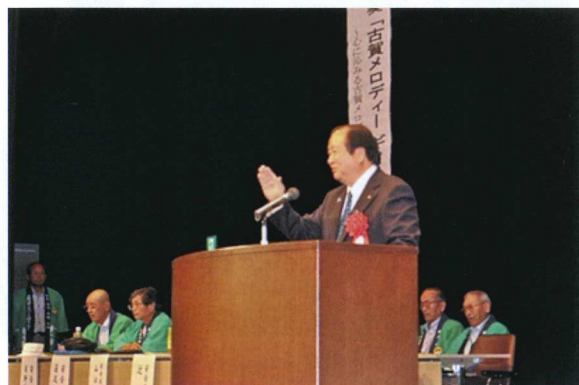
金子健次市長挨拶