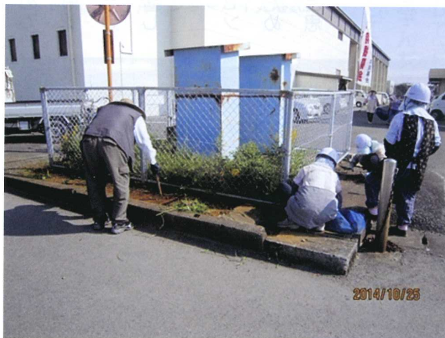
大和地区 (大和公民館周り)