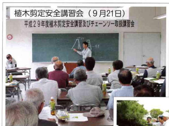
植木剪定安全講習会(9月21日)

(7月12日、9月13日、10月11日、11月8日) 「平成30年の干支の小物(戌)等を作りしました」 ※さげもん展示即売会 / さげもんめぐり等で販売