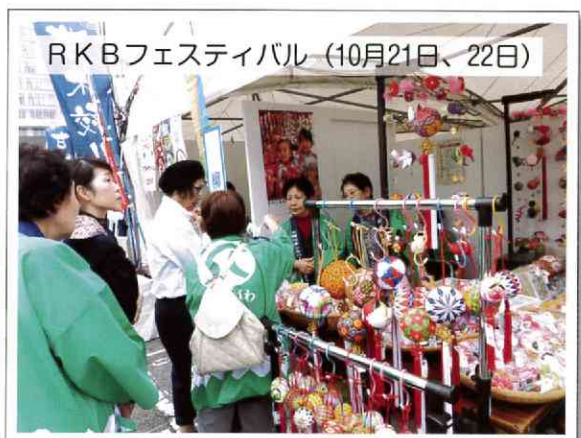
RKBフェスティバル(10月21日、22日)

「福岡市のRKB広場にてさげもん・小物・まり・ ソフトクリームの販売を行いました」