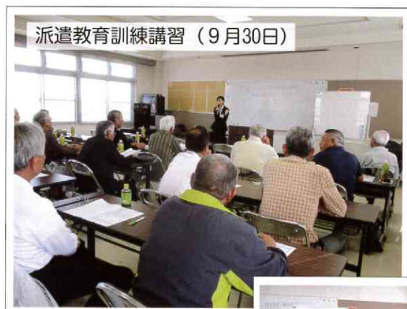
派遣教育訓練講習(9月30日)