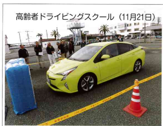
高齢者ドライビングスクール(11月21日)

「福岡市のRKB広場にてさげもん・小物・まり・ ソフトクリームの販売を行いました」