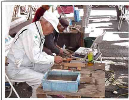
小物・まり等の作品