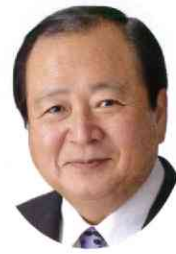
柳川市長 金子 健次