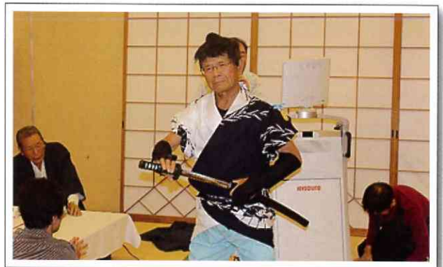
会員による「瞼(まぶた)の母」披露