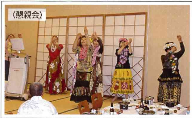
会員によるフラダンス披露