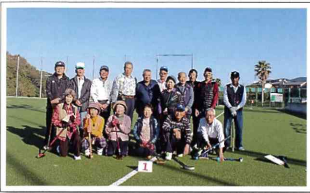
グラウンドゴルフ集合写真